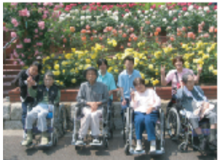
写真の前ではいチーズ